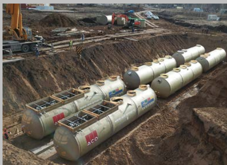
КОС ЭКО-Р-1000, ЖК "Цветы Башкирии", г. Уфа