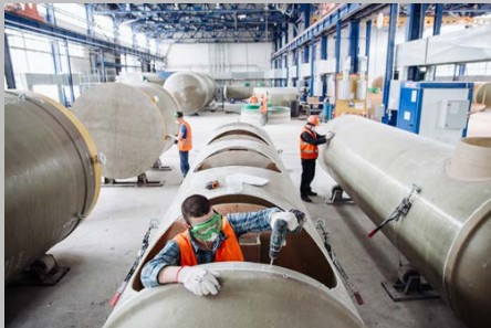
Производство г. Тольятти